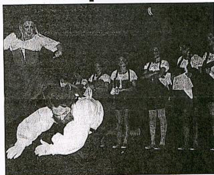
SEVRES ESPACE LOISIRS, JEUDI MATIN. « Le Petit Poucet » marque la progression de l'école du spectacle, qui a avancé comme une passerelle vers les écoles de comédie et les castings, notamment pour les séries M6. Car les enfants savent aussi danser et chanter.